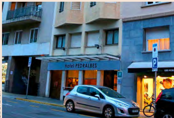
El Hotel Pedralbes, en el centro de la imagen.

El grupo inmobiliario Alting ha adquirido el Hotel Pedralbes, situado en el número 4 de la calle Fontcoberta de Barcelona. La compañía de la familia Marcos ha destinado seis millones de euros a la compra y reforma del establecimiento. El negocio era hasta el momento propiedad de Husa Hoteles, que también lo gestionaba. La administración concursal de la compañía puso en venta la finca para saldar deudas con los acreedores. P5