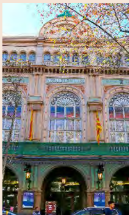
El teatro de las Ramblas.

El Liceu planea conciertos de ópera en las cárceles P8