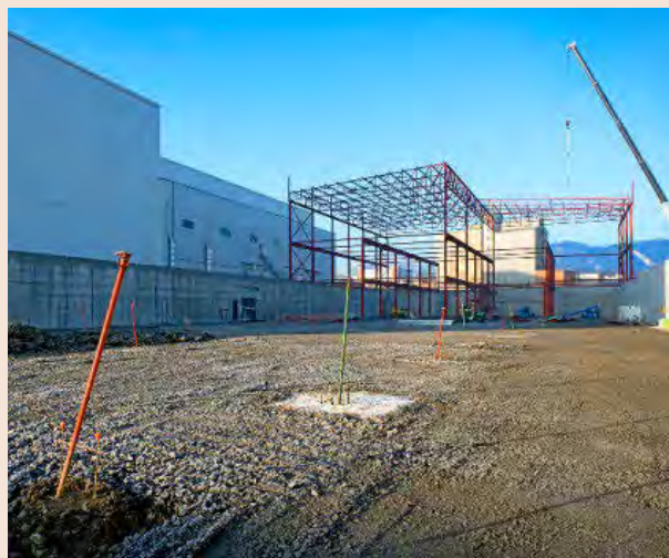
La nave se levanta junto a otra de las fábricas que tiene en Gurb.

Casa Tarradellas ha iniciado la construcción de una nueva planta especializada en la elaboración de pizzas frescas en Gurb (Osona). El proyecto supondrá una inversión de 25 millones de euros y generará medio centenar de puestos de trabajo. El refuerzo en la capacidad de producción coincide con el 20 aniversario del lanzamiento al mercado de las populares pizzas de la compañía familiar, que creó esta categoría de negocio en España. El grupo produce con su propia marca y también con la enseña de Mercadona, Hacendado . P3