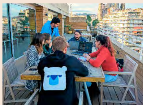
Los quince trabajadores de la plataforma trabajan desde Coworking en Barcelona.

El comparador online de precios de hoteles fue creado en Sídney hace doce años