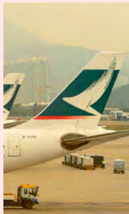
Un avión de Cathay.

Cathay volará entre El Prat y Hong Kong el próximo verano P3