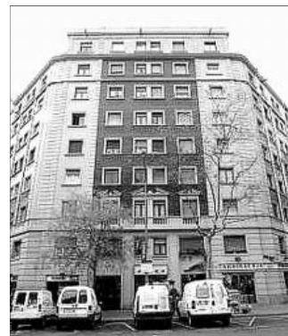
Alting ha pagado 9,5 millones por el edificio de Sant Antoni Maria Claret.