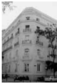
Sede de Ebro

Alting Grupo Inmobiliario ha comprado la sede de la empresa Ebro Puleva en Madrid. El inmueble, de 5.500 m 2 , se puso a la venta por el proceso de desinversión inmobiliaria del grupo de alimentación que busca recursos para impulsar el crecimiento. La inmobiliaria catalana Alting estudia diferentes usos al edificio, en el que se contempla su uso residencial como viviendas de lujo, sede corporativa o bien uso hotelero. La inmobiliaria prevé invertir más en las zonas principales de Barcelona, Madrid y otras capitales.